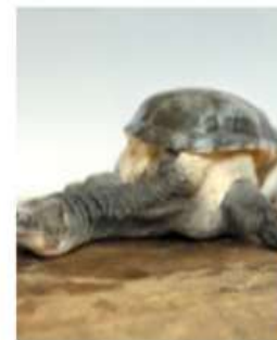
Австралийская змеиошейная черепаха