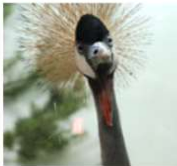
Восточный венценосный журавль