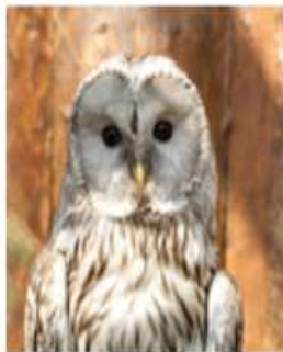
Длиннохвостая (уральская) неясыть