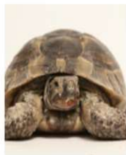
Среднеазиатская (степная) черепаха