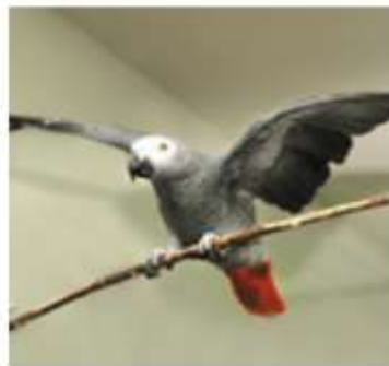
Жако или серый попугай