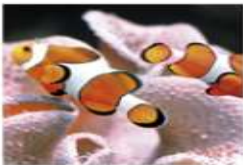
Анемоновая рыба (Рыба-клоун)