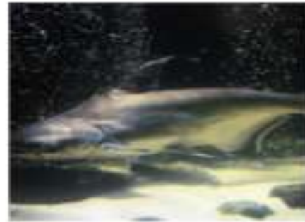
Высокоплавничный акулий сом