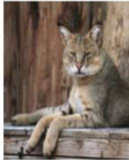
Камышовый кот, хаус