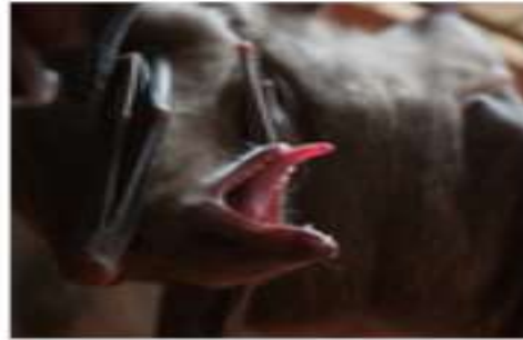
Египетская летучая собака или нильский крылан