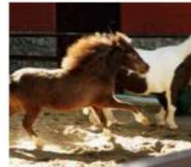
Американская миниатюрная лошадь