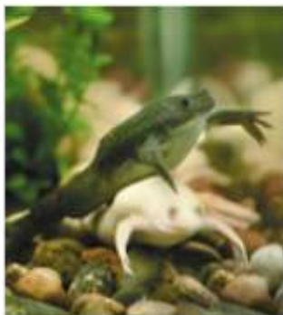
Гладкая шпорцевая лягушка