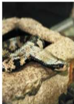
Гигантский бразильский уж