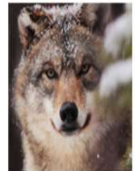
Серый волк/ Арктический волк