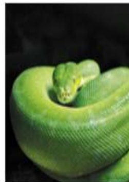
Зеленый (древесный) питон