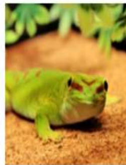
Мадагаскарский дневной геккон