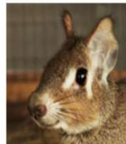
Чакоанская (карликовая) мара