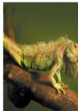
Обыкновенная (зеленая) игуана