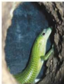
Смарагдовый (изумрудный) сцинк