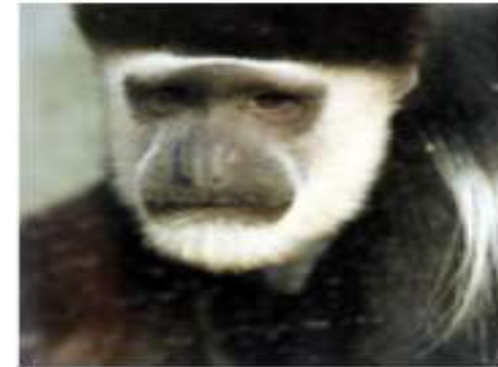
Восточный колобус или гверца