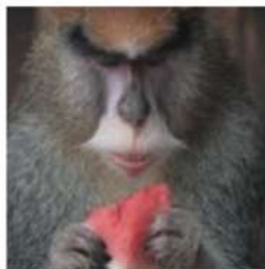
Красная Мартышка (гусар)