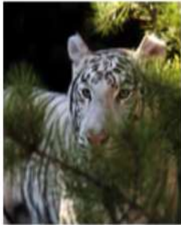
Бенгальский белый тигр