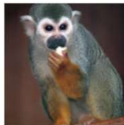
Обыкновенный (беличий) саймири