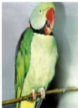
Ожереловый попугай Крамера