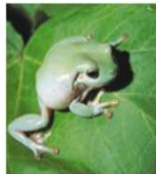
Австралийская голубая квакша