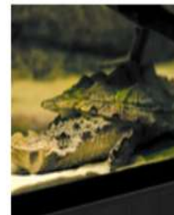
Бахромчатая черепаха (Мата-мата)