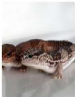
Африканский толстохвостый геккон