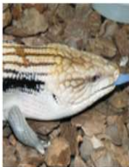
Австралийский синезычный сцинк