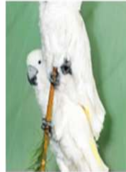
Большой белый какаду