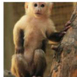
Белоплечий (обыкновенный) капуцин